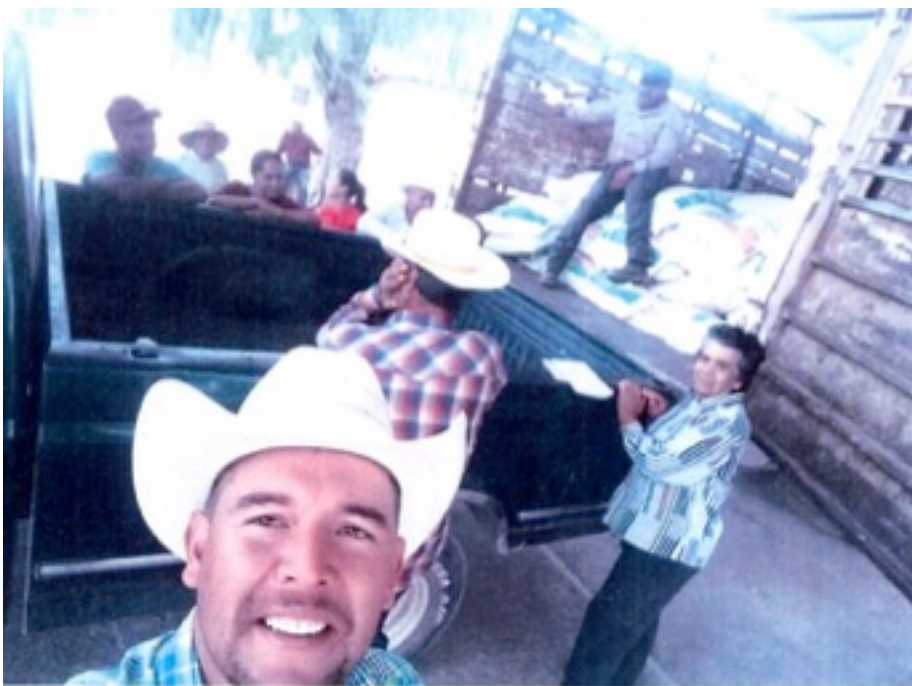
Imagen 4. Inserta en la foja cinco del escrito de denuncia

Se observan seis personas del género masculino y cuatro del género femenino al lado de un vehículo tipo pick-up color verde, además del área de carga de un vehículo tipo camión, en el cual se aprecian varios costales o sacos con contenido no determinado.