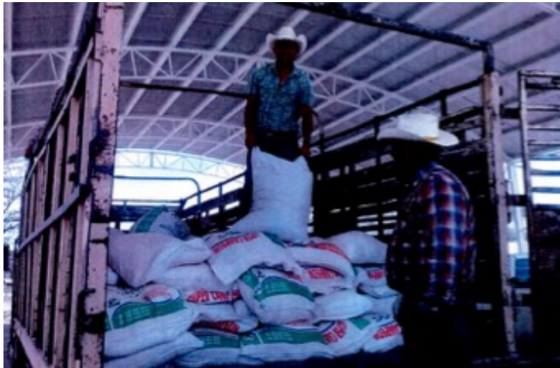
Imagen 5. Inserta en la foja seis del escrito de denuncia

Se observan dos personas del género masculino, uno de ellos dentro del área de carga de un vehículo tipo camión, el cual se encuentra sosteniendo un costal o saco de varios que se encuentran dentro de dicha área, con contenido no determinado, la otra persona se encuentra de pie fuera del referido vehículo.