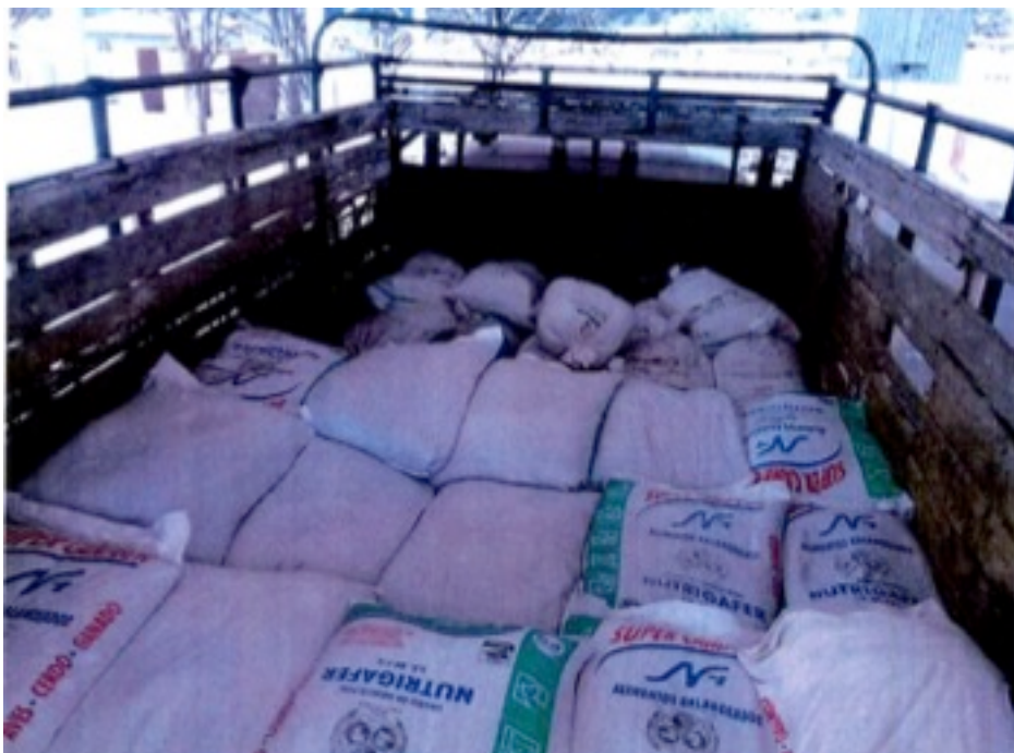
Imagen 2. Inserta en la foja cuatro del escrito de denuncia

Se observa el área de carga de un vehículo tipo camión, dentro de la que se encuentran varios costales o sacos con contenido no determinado, los cuales contienen leyendas como “NUTRIGAFER”, “ALIMENTOS BALANCEADOS”, “AVES - CERDO- GANADO”.