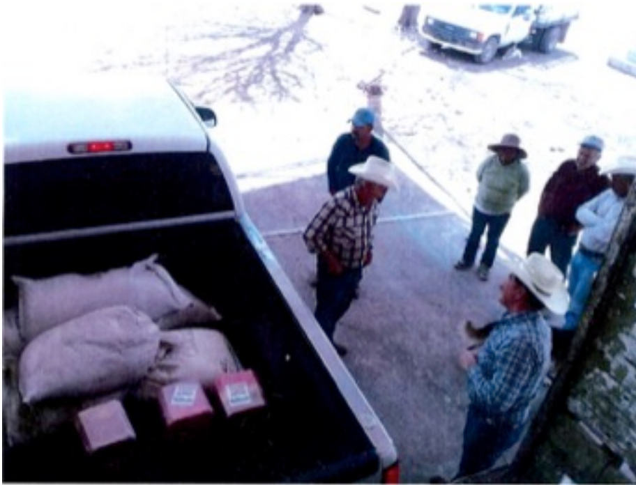
Imagen 3. Inserta en la foja cinco del escrito de denuncia

Descripción realizada en la Imagen 1, por ser la misma imagen.