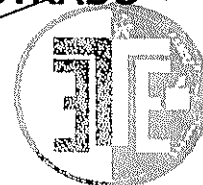
TRIBUNAL ESTADAL ELECTORAL DE CHIHUAHUA