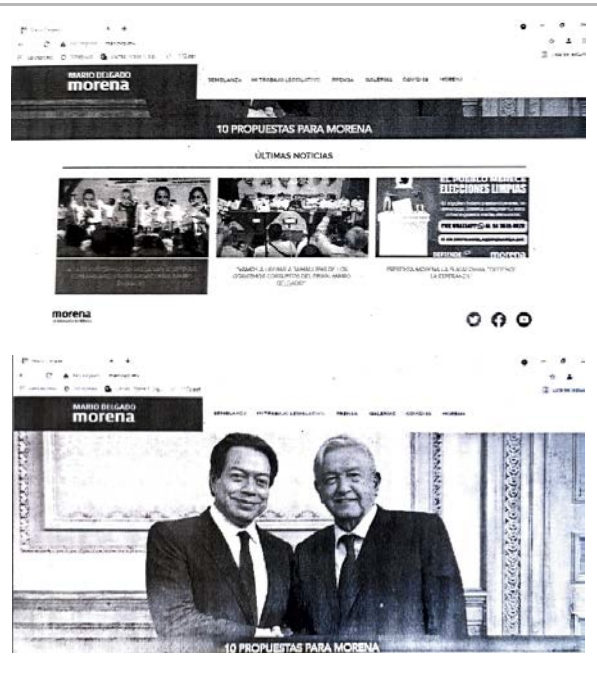
[4] 25 de mayo 2021 5 :