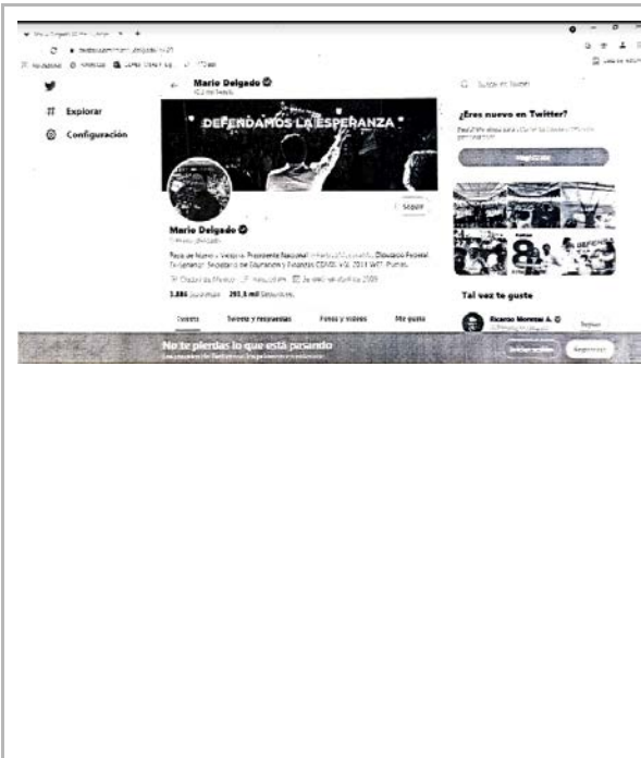
[3] 25 de mayo 2021 4 :